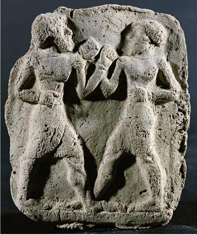
Dögüşen iki Mesopotamialı boksörü gösteren, İ.Ö. 2000 civarına tarihli, pişmiş topraktan bir kabartma

si övüldü. 1500 övüne tarihlenen bir Güneşli Bahçeler Buldu. K. Güneşli Bahçeler Buldu. The